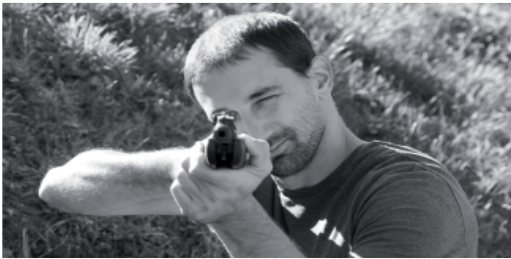
Séance de shooting